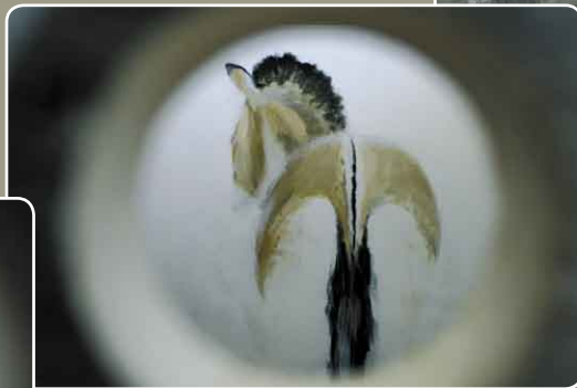
Vier Ansichten eines Urwildpferds (Acryl auf Leinwand, 2007)